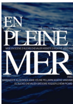
En pleine mer de SŁAWOMIR MROŹEK Une fable grinçante sur la démocratie

La Compagnie Le Saut du Tremplin propose d'autres créations, n'hésitez pas à nous contacter pour plus d'informations.