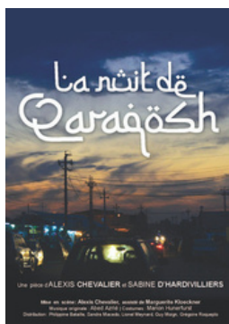
La Nuit de Qaraqosh d'Alexis Chevalier et Sabine d'Hardivilliers. Une tragédie moderne sur les minorités irakiennes