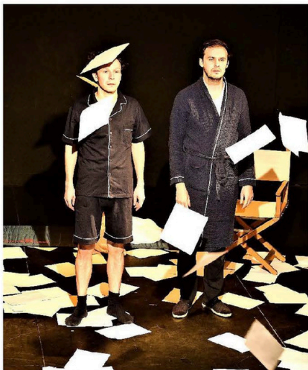
Ceci n'est pas une saucisse.